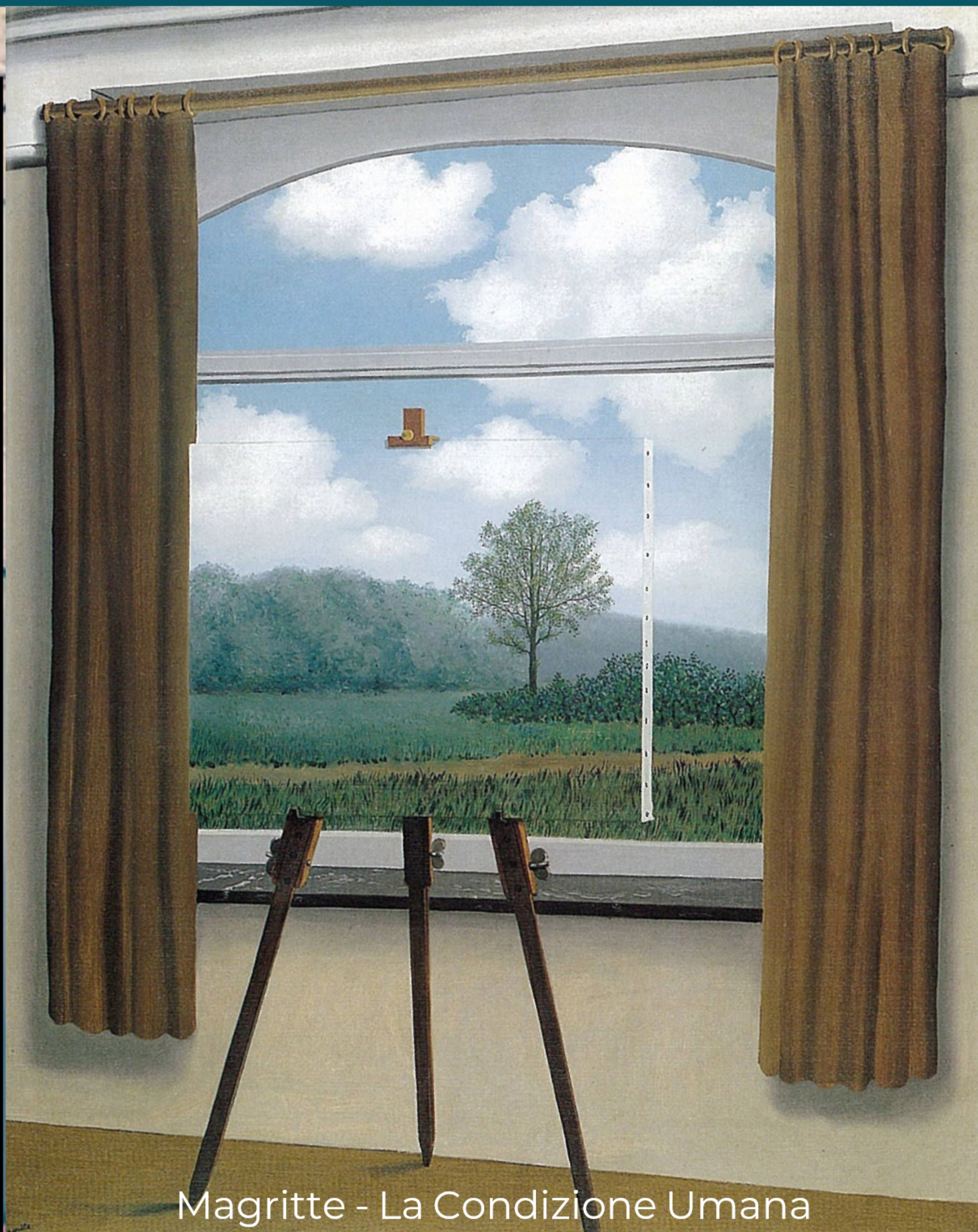
Magritte - La Condizione Umana

“LE IMMAGINI VANNO VISTE QUALI SONO, AMO LE IMMAGINI IL CUI SIGNIFICATO È SCONOSCIUTO POICHÉ IL SIGNIFICATO DELLA MENTE STESSA È SCONOSCIUTO.”